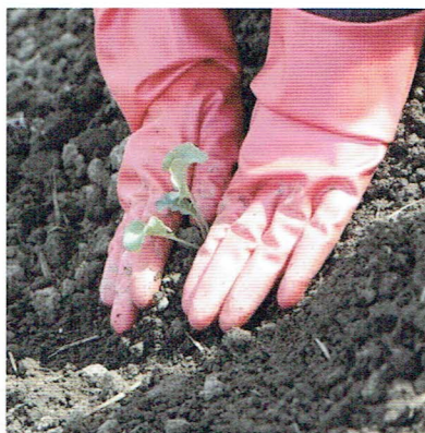
↑2月に苗植えたブロッコリー